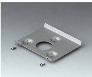
B4514101 Wandhalter 140 Stahl verzinkt