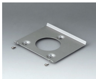
B4518101 Wandhalter 180 Stahl verzinkt