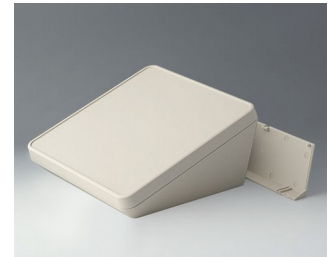
B4422207 PROTEC 220, Ausf. II ASA+PC-FR (UL 94 V-0) grauweiß RAL 9002 220x220x108mm