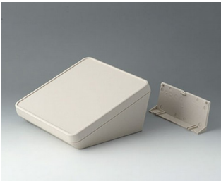
B4418207 PROTEC 180, Ausf. II ASA+PC-FR (UL 94 V-0) grauweiß RAL 9002 180x180x92mm