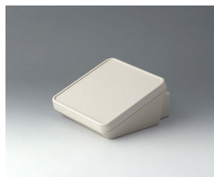
B4414307 PROTEC 140, Ausf. III ASA+PC-FR (UL 94 V-0) grauweiß RAL 9002 140x160x76mm