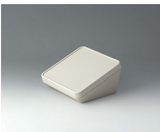
B4414107 PROTEC 140, Ausf. I ASA+PC-FR (UL 94 V-0) grauweiß RAL 9002 140x140x76mm