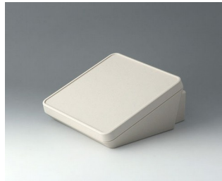
B4418307 PROTEC 180, Ausf. III ASA+PC-FR (UL 94 V-0) grauweiß RAL 9002 180x201x92mm