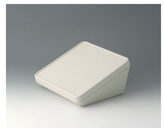
B4418107 PROTEC 180, Ausf. I ASA+PC-FR (UL 94 V-0) grauweiß RAL 9002 180x180x92mm