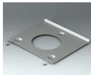
B4522101 Wandhalter 220 Stahl verzinkt