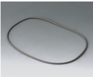
B4514030 Dichtungs-Set 140