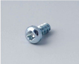
A0305031 Selbstformende Schraube 2,5 x 6 mm (PZ1)