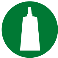
Konfektion / Montage