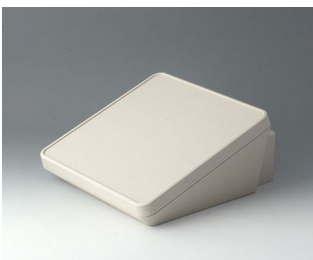
B4422307 PROTEC 220, Ausf. III ASA+PC-FR (UL 94 V-0) grauweiß RAL 9002 220x243x108mm