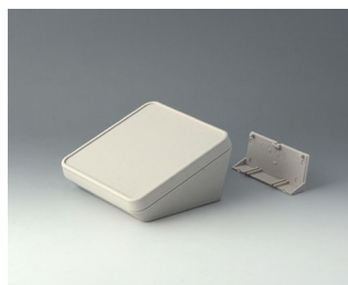
B4414207 PROTEC 140, Ausf. II ASA+PC-FR (UL 94 V-0) grauweiß RAL 9002 140x140x76mm