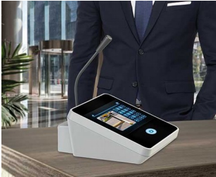
Tischmikrofon / Sprechanlage

Überwachungsanlagen, Zugangskontrolle Datenerfassungssysteme Gebäudetechnik, Steuerungszentralen IoT/IIoT Smart Factory Industrie 4.0 Gateways Computerperipherie Mess- und Regeltechnik Medizintechnik, Health Care