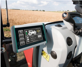
ISOBUS-Terminal für Traktoren und selbstfahrende Arbeitsmaschinen

Peripherie- und Interfacegeräte Office Kommunikationstechnik Sicherheitstechnik Biometrie Medizin- und Labortechnik Health Care Automatisierung Smart Factory Industrie 4.0 Mess-, Regel- und Steuertechnik