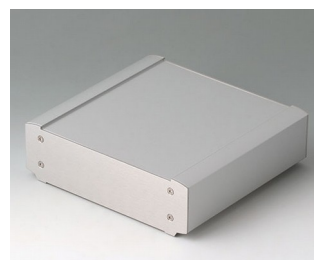
B3407013 SMART-TERMINAL 160 Aluminium AlMgSi 0,5 matt eloxiert 164x170x50mm