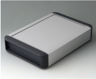
B3407022 SMART-TERMINAL 200 Aluminium AlMgSi 0,5 matt eloxiert 242x170x50mm