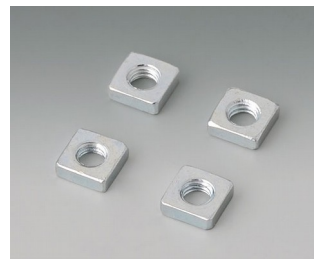
B3500001 Vierkantmuttern-Set M3 Stahl