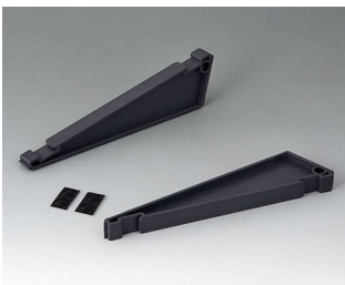
B3507030 Pultaufsteller-Set ASA+PC-FR (UL 94 V-0) lava