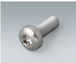
A0330080 Schraube M3 x 8 mm (T10) Edelstahl