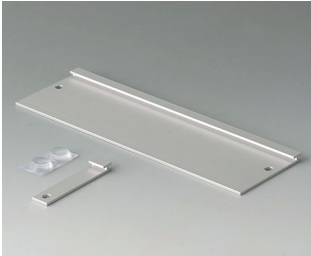
B3507020 Wandhalter-Set Aluminium