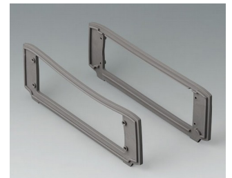
B3507017 Designdichtungs-Set, vulkan TPV 50A vulkan