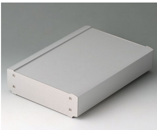
B3407033 SMART-TERMINAL 240 Aluminium AlMgSi 0,5 matt eloxiert 244x170x50mm