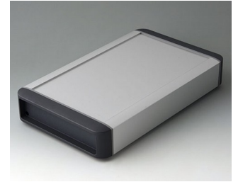
B3407032 SMART-TERMINAL 240 Aluminium AlMgSi 0,5 matt eloxiert 282x170x50mm