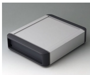
B3407012 SMART-TERMINAL 160 Aluminium AlMgSi 0,5 matt eloxiert 202x170x50mm