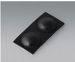
A9209229 Anti-Rutsch-Füßchen 8,5 x 2,2 mm schwarz

Technische Änderungen vorbehalten. © OKW Gehäusesysteme, Buchen/Deutschland.