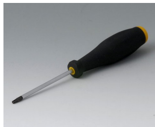
A0399T10 Torx Schraubendreher T10