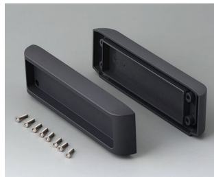
B3507011 Abdeckkappen-Set ASA+PC-FR (UL 94 V-0) lava