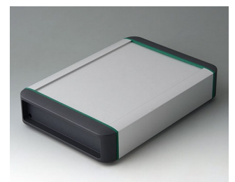
B3407021 SMART-TERMINAL 200 Aluminium AlMgSi 0,5 matt eloxiert 242x170x50mm