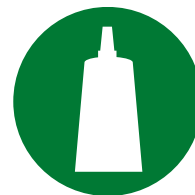
Konfektion / Montage