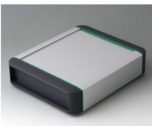
B3407011 SMART-TERMINAL 160 Aluminium AlMgSi 0,5 matt eloxiert 202x170x50mm