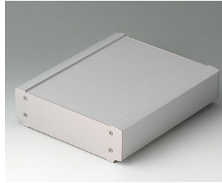
B3407023 SMART-TERMINAL 200 Aluminium AlMgSi 0,5 matt eloxiert 204x170x50mm