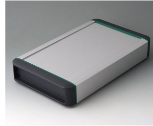
B3407031 SMART-TERMINAL 240 Aluminium AlMgSi 0,5 matt eloxiert 282x170x50mm