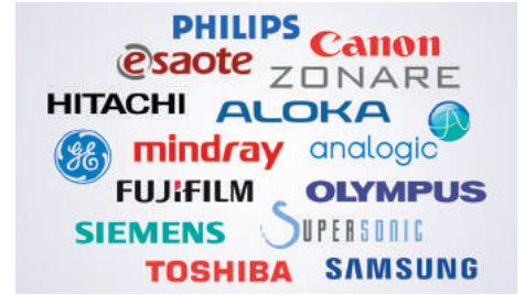
Messdatenübernahme von Geräten aller Hersteller