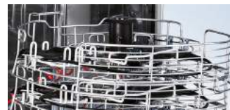
EndoClean – Protokolle von Waschmaschinen archivieren