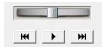
VCache – Lange Sequenzen einfach bearbeiten