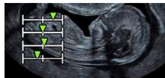
Pränataldiagnostik – Messwerte grafisch darstellen