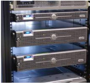
Interaktion mit KIS und PACS