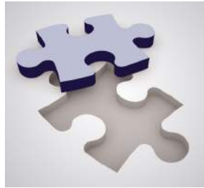
Modularer Aufbau nach Ihren Bedürfnissen