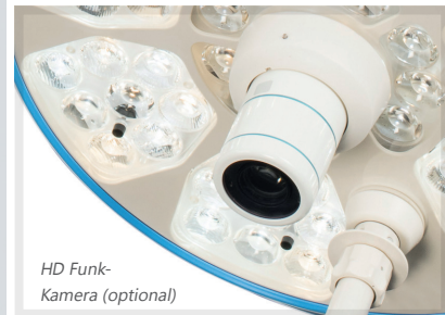
HD Funk-Kamera (optional)